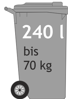
240 l bis 70 kg H = 107,6 cm B = 58,0 cm T = 73,0 cm