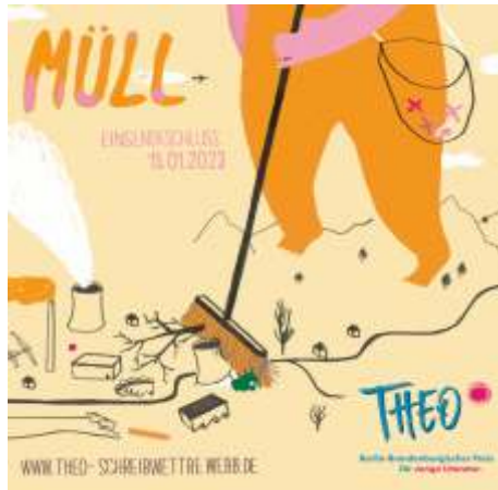
Plakatgestaltung: Julia Dürr

Der Börsenverein des Deutschen Buchhandels Berlin-Brandenburg e. V. ruft gemeinsam mit dem wortbau e. V. alle Schüler*innen bis 20 Jahre zur Teilnahme am Schreibwettbewerb THEO zum Thema „Müll“ auf. Einsendeschluss der Texte ist am 15. Januar 2023.