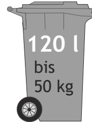
120 l bis 50 kg H = 93,5 cm B = 49,0 cm T = 55,3 cm