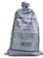
90 l bis 20 kg